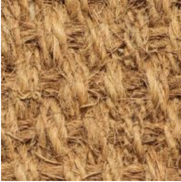
natur | 000