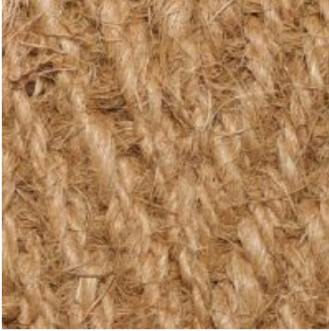
Bangalore-Laeufer - natur | 001