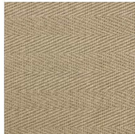
flachs | 060