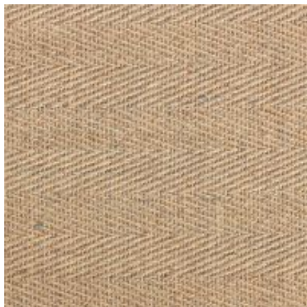
sand | 005