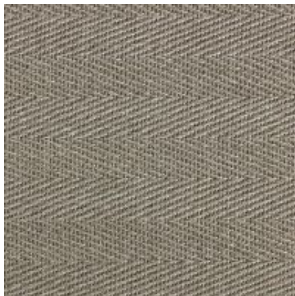
stein | 041